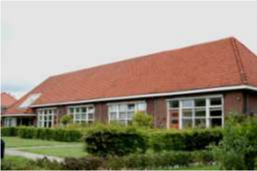
Verbouwd tot appartementen anno 2007