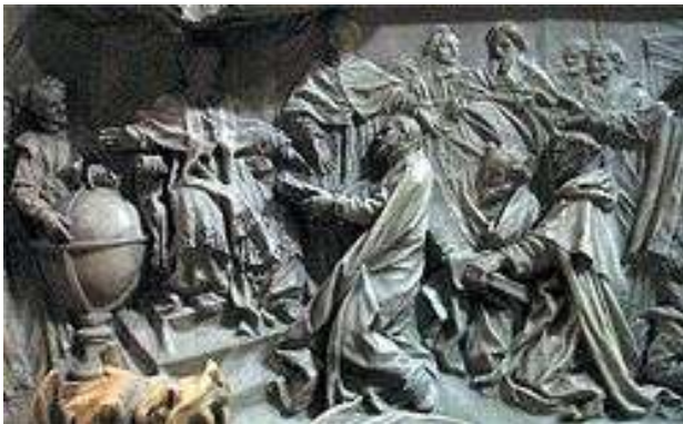
Een afbeelding van de invoering van de kalender door Paus Gregorius XIII op zijn graftombe

)*De kalender is in 1582 ingevoerd in Rome door Paus Gregorius XIII. Daarvoor gold de Juliaanse kalender ingevoerd door Julius Ceasar.