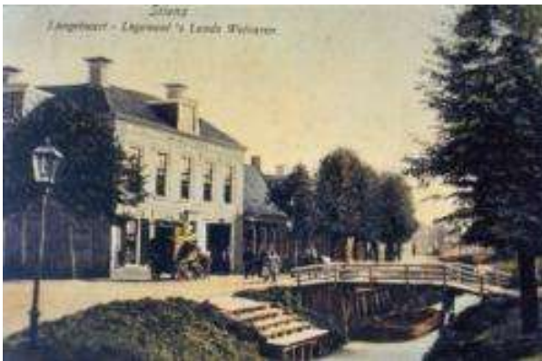
Lands Welvaren begin 20 e eeuw.