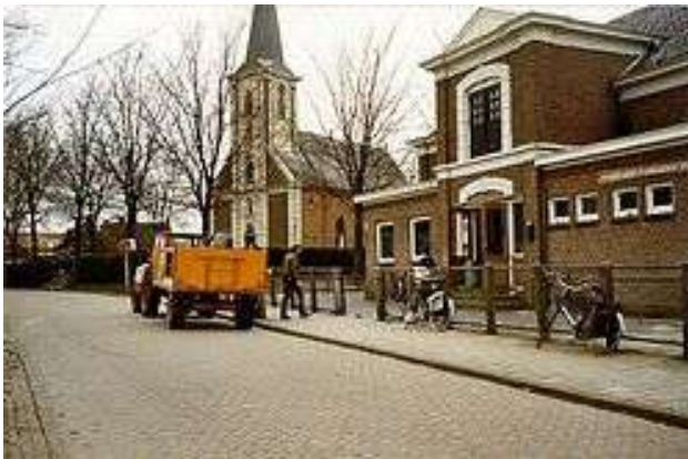
De eerste openbare lagere school in Britsum