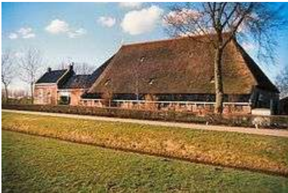
Zijlstra 's plaats aan de Trijehoeksweg

In 2010 heeft aannemer SK Bijland de boerderij gekocht en verbouwd tot woonboerderij. De zuidzijde heeft dienen-gevolge een forse ingreep ondergaan door het situeren van een ruime ingangspartij aan die zijde. Verder is de bestaande vormgeving aan de buitenzijde niet aangetast. Zelfs de karakteristieke kippenladder aan de oostmuur is niet verdwenen, maar vernieuwd.