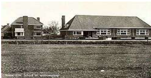
Nieuwe Chr.School van 1930 met schoolhuis

De school draagt - al is het bescheiden - de signatuur van de bouwstijl van de Amsterdamse school. Het is zichtbaar door het met rode pannen gedekte forse dak voorzien van royaal overstek, de raamindelingindeling en het metselwerk van het gebouw en het muurtje om het schoolplein. Na de bouw van Flecht aan de Gysbert Japixstritte in 1972 heeft het gebouw lange tijd leeg-gestaan. In 2007 is het verbouwd tot 4 appartementen.