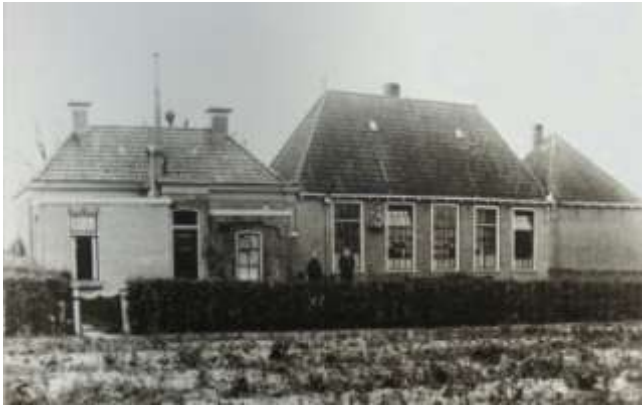
Foto uit het begin van de 20 e eeuw. Links het onderwijzershuis, midden twee klaslokalen Rechts derde lokaal.