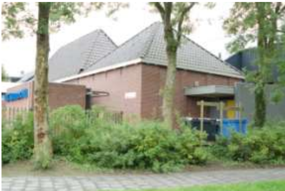
Westzijde van het schoolgebouw als onderdeel van het dorps huis de KAMPIOEN