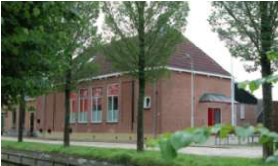
Noordzijde van het voormalige schoolgebouw