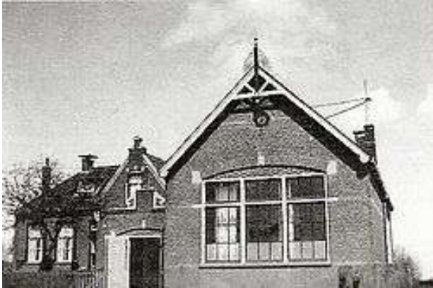
De eerste Chr. Lagere school aan de Lytse Dyk (Niet meer aanwezig)