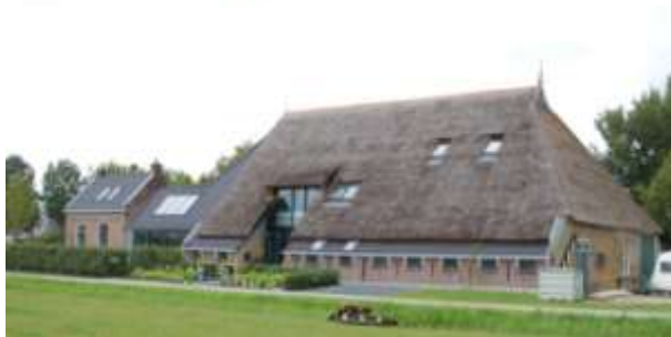
Na de verbouwing tot woonboerderij in 2011