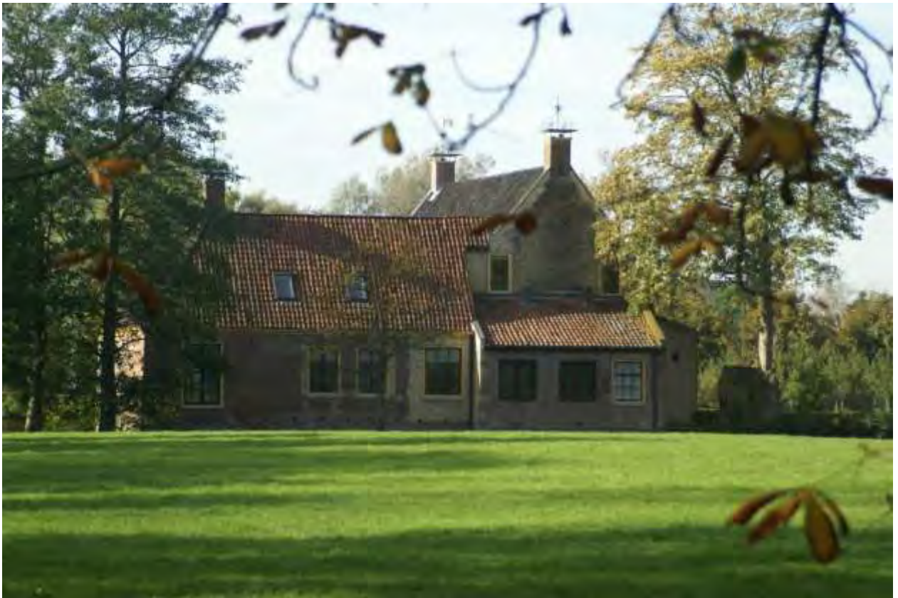
Dekema State, Jelsum