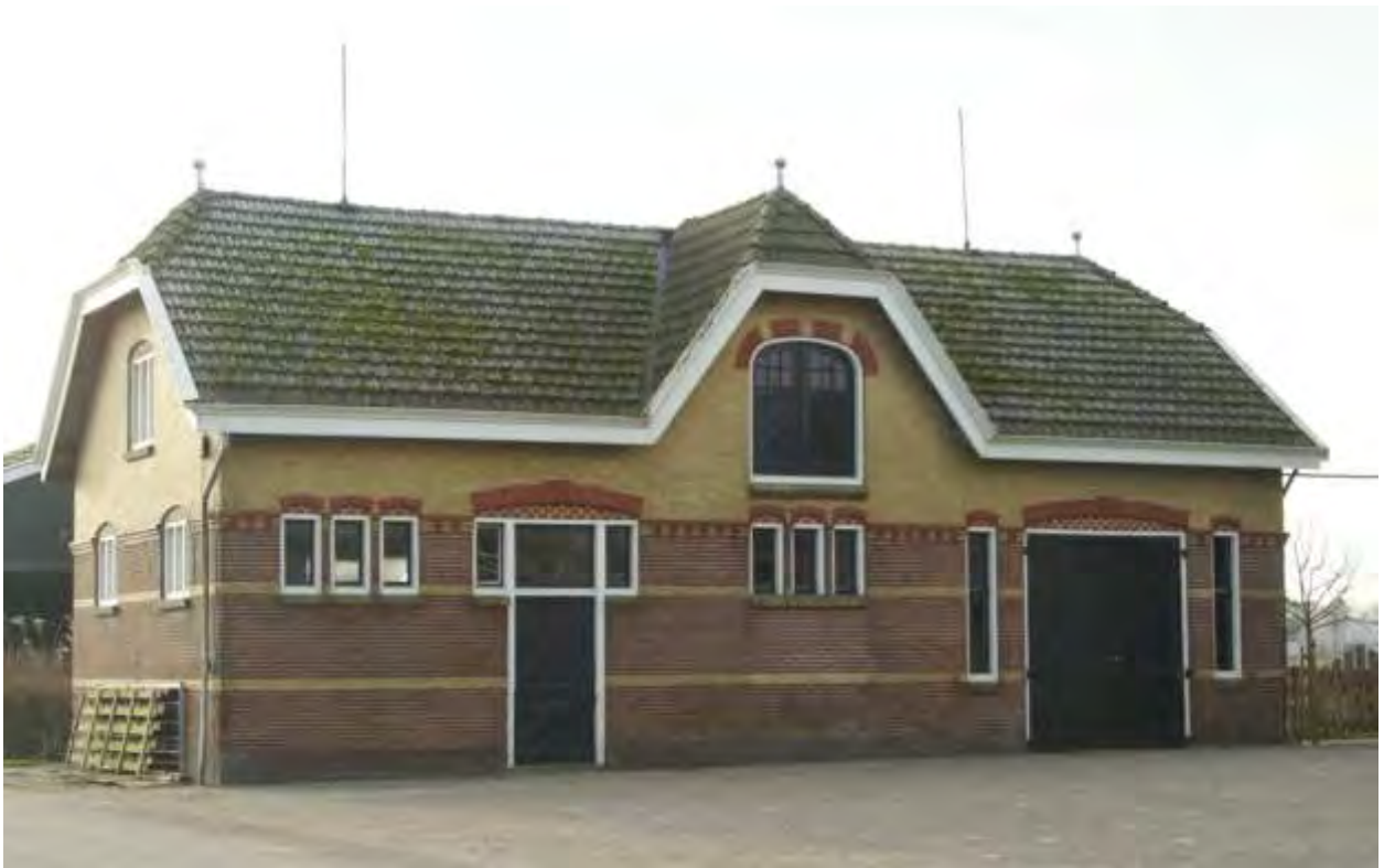
Koetshuis Haskerazathe, Jelsum