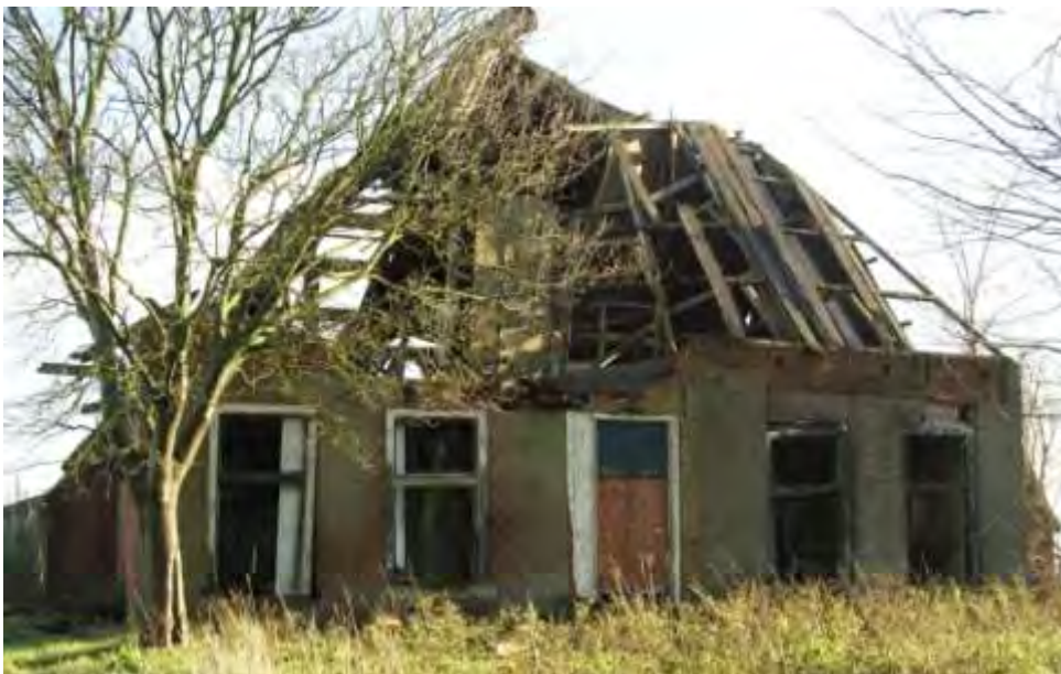
Hege Hearewei 12, Feinsum (bij ministerieel besluit januari 2010 van de monumentenlijst verwijderd)