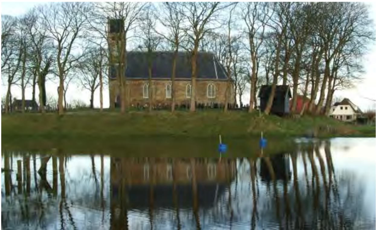
Hervormde kerk, Hijum