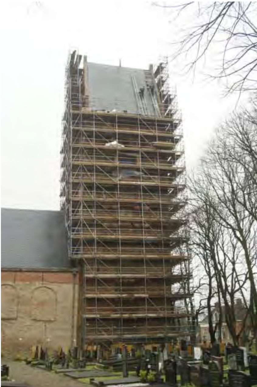
restauratie Sint Vitustoren 2009-2010, Stiens