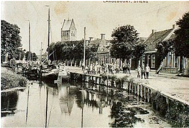
Afbeelding, Gezicht op de zwaai kom aan de Langebuorren 1910

‘Dat Stiens een kapitaal- dorp is, behoeft de bezoeker niet te vragen, als hij den aanbouw van deftige renteniershuizen in ‘oogenschouw’ neemt, welke hier de laatste jaren zijn verzezen langs de vaart en aan den hoofdweg, in grooter getale dan ergens elders ten platten lande gezien wordt, met kapitale herbergen advenant.’ Deze burger- en herenhuizen, waaronder verschillende middengangwoningen, zijn vooral te vinden aan de Lege Hearewei, Smelbrêge, Langebuorren en Uniawei.