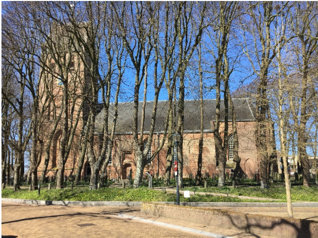
Afbeelding, Sint Vituskerk Stiens voorjaar 2022 (Y. Visser, Stiens )

terpen “gelukkig” grotendeels gespaard. Stiens groeide tot een belangrijk terpdorp in de gemeente Leeuwarderadeel. In de 13e eeuw vermeldde men Stiens als Steninge, in 1335 als Steynsinghum, in 1399 als Stienzede en Steenzede, in 1418 als Stenze en in 1466 als Steens. In de 16e eeuw als Steninge of Steens . De naam zou verwijzen naar een individu Stena of een familie Steninge. In het hart van Stiens ligt de hervormde Sint-Vituskerk . Deze kerk gesticht als katholieke kerk door Benedictijnen van Abdij Corvey aan de Wezer was een zusterkerk van de Sint-Vituskerk van Oldehove. Men wijdde de kerk aan de heiligen Vitus en Anna. In de lege nissen naast de deur in de toren stonden waarschijnlijk beelden van genoemde Vitus en Anna gestaan. De Sint-Vituskerk is een robuuste kerk met forse zadeldaktoeren. Het romaanse tufstenen schip bouwde men aan het einde van elfde of begin twaalfde eeuw.